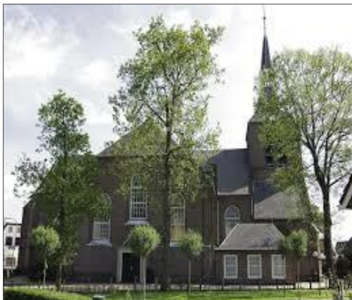
Hervormde Dorpskerk Oldebroek