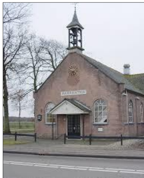
Maranathakerk 't Loo