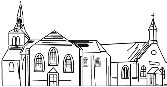
Hervormde gemeente Oldebroek