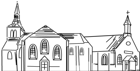
Hervormde gemeente Oldebroek